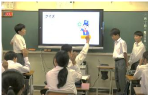
定期考査に向けての学級活動

あと1か月で夏休み、夏休み後には期末考査があります。今学習している内容が、まさに期末考査のポイントになります。「このままではまずいな」と思った人は、今からできることを明確にして取り組んでみるのが大切です。うまくいかなかったことがあれば、次にどうすればよいかを考えるチャンスととらえ、違う学習方法を試してみたり、カテガクノートを活用したりと新たなチャレンジをしてみましょう。